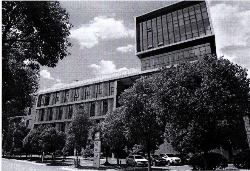
图 1 公司照片

南京市企业技术中心；且在 2014 中国江苏创新创业大赛、第二届江苏科技创业大赛中分别获得一等奖、二等奖。